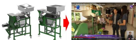
ภาพที่ 1 ต้นแบบผลิตภัณฑ์ระยะที่ 1 เพื่อประเมินผลพยากรณ์และพัฒนาในระยะที่ 2

การวิจัยในครั้งนี้เกิดขึ้นจากการต่อยอดผลลัพธ์ของการวิจัย “การศึกษาและพัฒนาเครื่องแปรรูปพริกขี้หนูเพื่อการผลิตดินเทียมสำหรับเกษตรอินทรีย์” ที่ได้รับทุนวิจัยจากสำนักงานคณะกรรมการวิจัยแห่งชาติ ประจำปีงบประมาณ 2559 ตามสัญญาเลขที่ A118-59-027 ผลลัพธ์คือ กระบวนการแปรรูปพริกขี้หนูและเครื่องจักรต้นแบบ จำนวน 2 เครื่อง (ดังภาพประกอบที่ 1) ขึ้นจัดจำหน่ายและบรรจุภัณฑ์ดินเทียมจากพริกขี้หนู จำนวน 21 ชิ้นงาน และได้ทำการยื่นขอจดสิทธิบัตรทางการออกแบบ จำนวน 6 ชิ้นงาน พบว่า ดินเทียมจากเศษอาหารทั้ง 3 สูตรนั้นมีค่าความชื้นอยู่ที่ 4.58 2.97 และ 6.36 มีค่าดัชนีการงอกอยู่ที่ 80.07 90.15 และ 95.90 ปริมาณธาตุไนโตรเจนที่พบคือ 0.80 1.32 และ 1.49 % ปริมาณธาตุฟอสฟอรัสที่พบคือ 0.41 2.19 และ 1.23 % ปริมาณของธาตุโพแทสเซียมที่พบคือ 0.85 1.04 และ 1.47 % มีค่า pH อยู่ที่ 8.35 7.36 และ 8.13 ตามลำดับ ซึ่งดินเทียมจากเศษอาหารสามารถมีการเจริญเติบโตใกล้เคียงกับดินผสมการค้า ในส่วนดินเทียมจากเศษอาหารเพื่อปลูกต้นไม้ให้เกิดประโยชน์ เพื่อให้สิ่งแวดล้อมสวยงาม ลดปริมาณขยะมูลฝอย